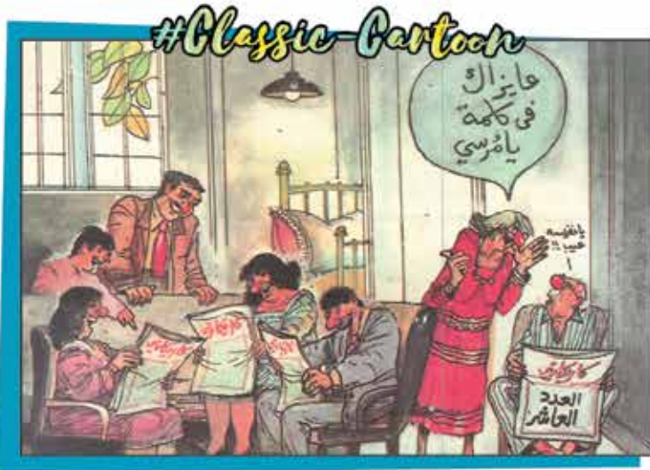
رسم حسن حاكم - Hassan Hakem | من «منشورة كاريكاتير» المصرية - العدد العاشر