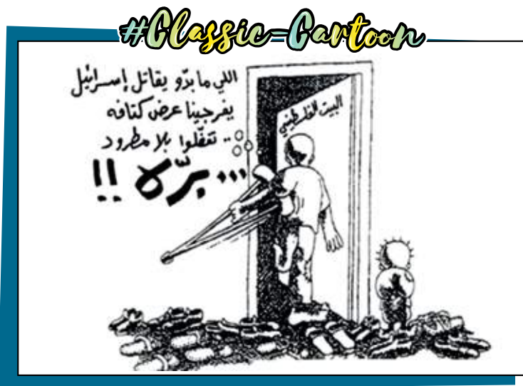
رسم ناجي العلي - By Naji Al Ali - Handala.org