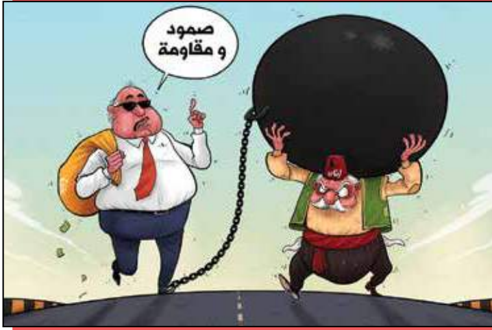
رسم فهد البهادي - Fahed Al Bahady