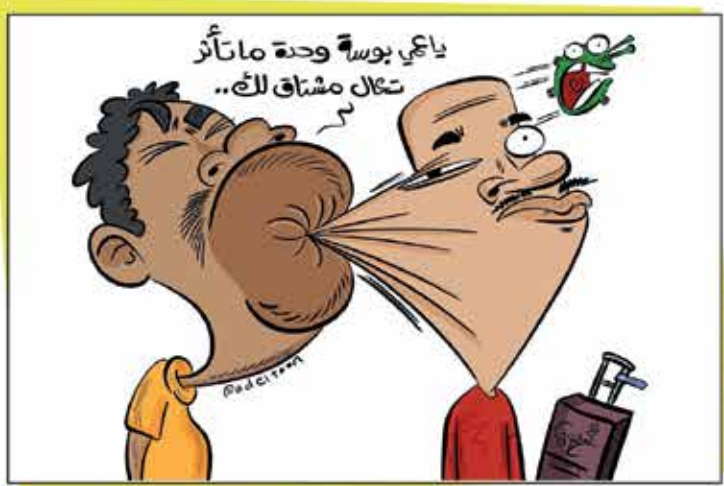
رسم عادل القلاف - Adel Al Qallaf | @Adel Al-Qallaf