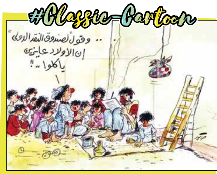
رسم حسن حاكم - By Hassan Hakem | موقع إلكتروني «المصري اليوم»