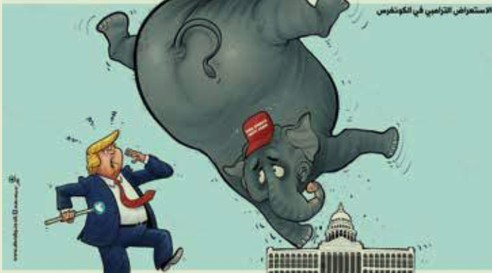
الاستعراض الترامبي في الكونغرس - ٩ كانون الثاني ٢٠٢١