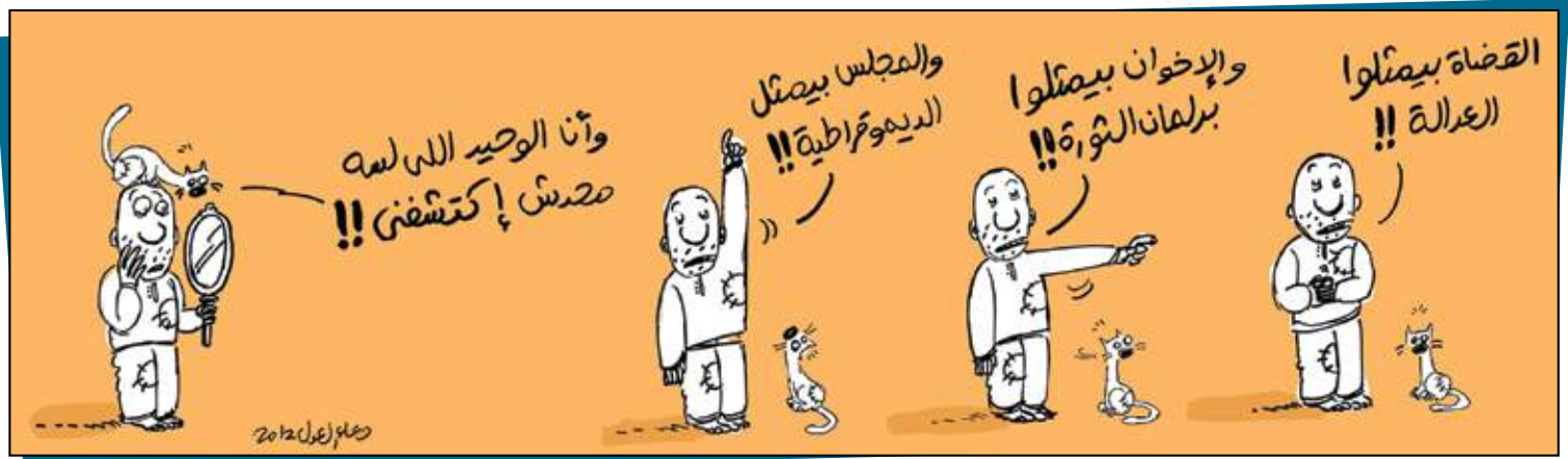
رسم دعاء العدل - By Doaa El Adl | موقع الفنانة دعاء العدل على الفيسبوك