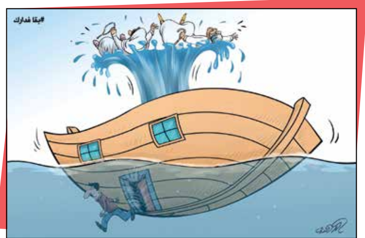
رسم عبد الغني الدهدوه - By Abdul Ghani Dahdouh - Caricaturiste Dahdouh

www.toshfesh.com f @ toshfesh Tel: +961 1 785 179