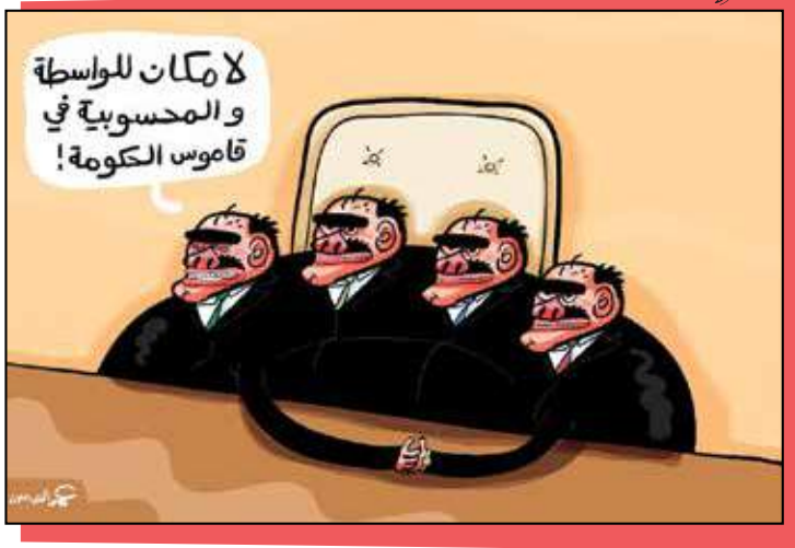
رسم عمر العبدالات - Omar Abdallat