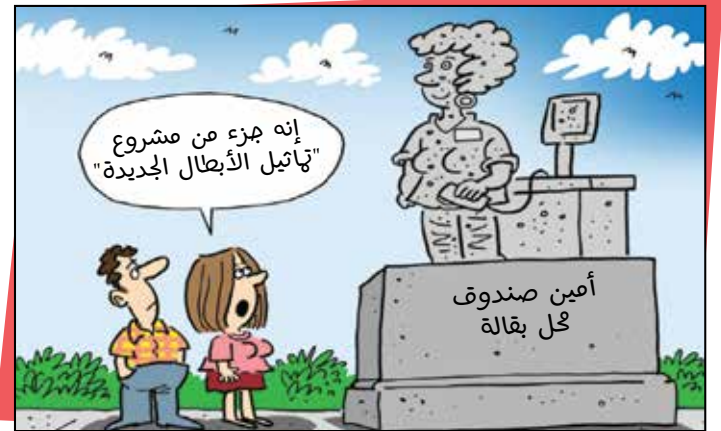
By Bob Englehart - رسم بوب إنجليهارت | موقع إلكتروني «ذا ويك»

هذا الجورنال يصدر عن شركة طش فش الناشر: معتر الصوّاف جميع الحقوق محفوظة للرسامين هذه الرسومات والآراء المنشورة لا تعبر عن رأي دار النشر أو وجهة نظره. www.toshfesh.com f @ toshfesh Tel: +961 1 785 179