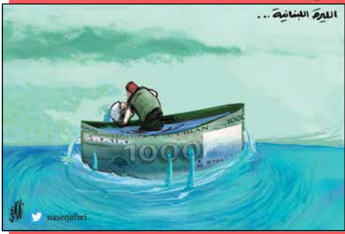
By Naser Jafari - رسم ناصر الجعفري