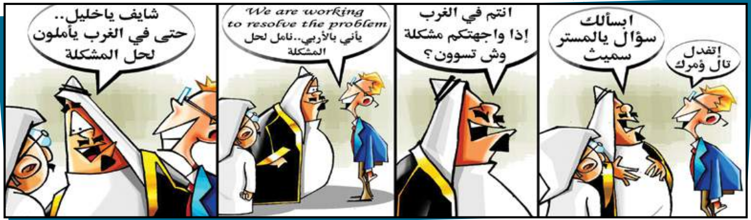
رسم فهد الخميسي - Fahed Al Khamisi