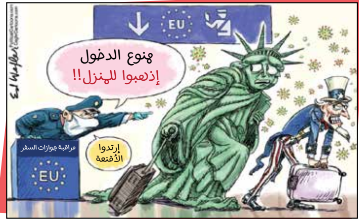
رسم إيد ويكسلير - By Ed Wexler | موقع إلكتروني «كايجل»

هذا الجورنال يصدر عن شركة طش فش الناشر: معتر الصواف جميع الحقوق محفوظة للرسامين هذه الرسومات والآراء المنشورة لا تعبر عن رأي دار النشر أو وجهة نظره. www.toshfesh.com f @ toshfesh Tel: +961 1 785 179