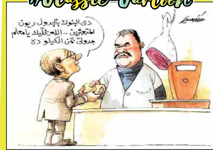
By Mustafa Hussein - رسم مصطفى حسين | موقع إلكتروني «إسكتشات»