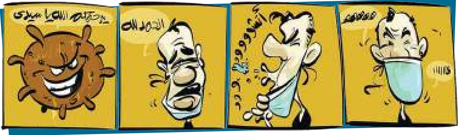
By Ahmed Geassa - رسم أحمد جعيصة | موقع الفنان أحمد جعيصة على الفيسبوك