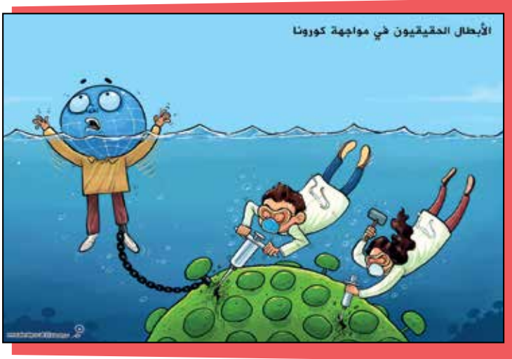
رسم فهد البحادي - By Fahd Bahady - فهد فهد