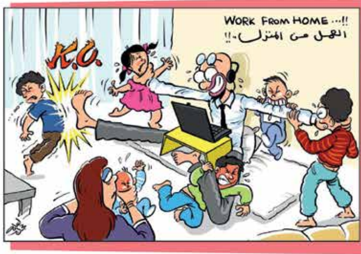
رسم أسامة حجاج - Osama Hajjaj | @osamahajjaj