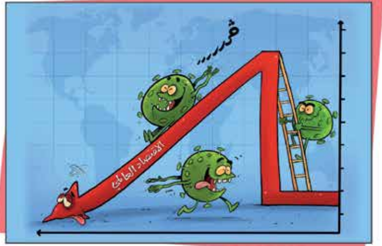
رسم أحمد رحمة - Ahmad Rahma | @rahma_toons

www.toshfesh.com f @ toshfesh Tel: +961 1 785 179