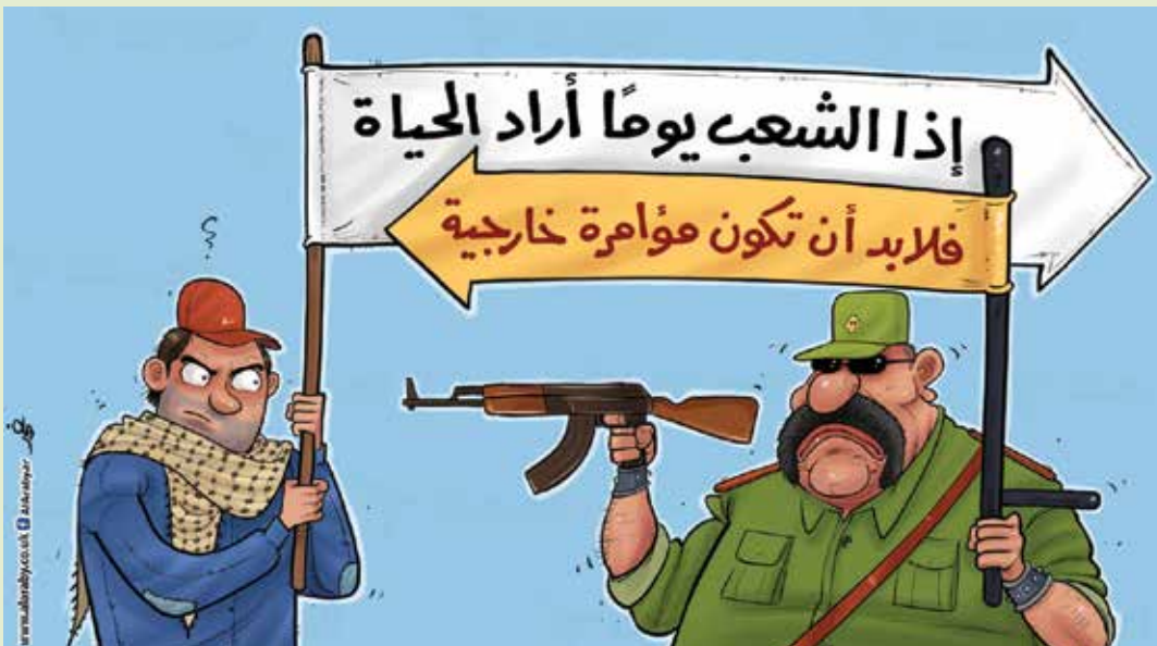
نظرية المؤامرة عند عصابات العسكر - تشرين الثاني ٢٠١٩