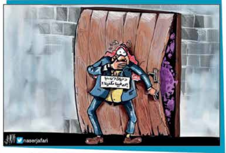
رسم ناصر الجعفري - Naser Jafari | Cartoonist Naser Jafari