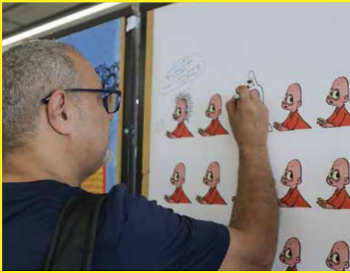
The artist Emad Hajjaj in the Engaging with the Arab Comics Archive: Rethinking Gender, Voice and Identity Exhibition

مركز رادا ومعتز الصواف لدراسات الشرائط المصورة العربية في الجامعة الأميركية في بيروت