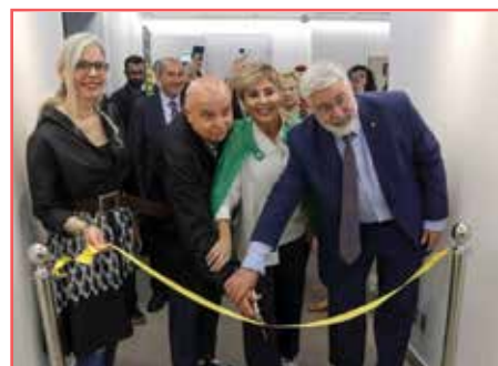
افتتاح مركز رادا ومعتز صواف لدراسات الشرائط المصوّرة العربية The opening of the Rada and Mutaz Sawaf Center for Arab Comics Studies