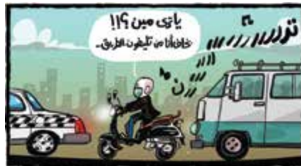
أحمد عكاشة / Ahmed Okasha